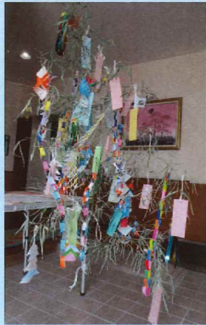
ささのはさ～らさら～♪ みんなの願いがかなうといいね