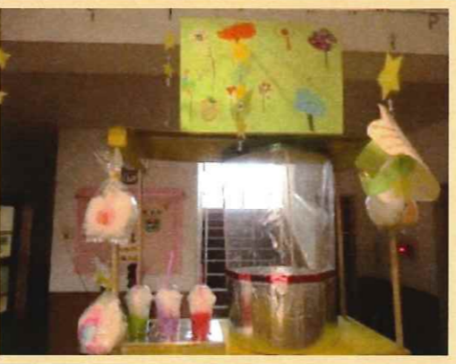
ほんものみたい でおいしそう