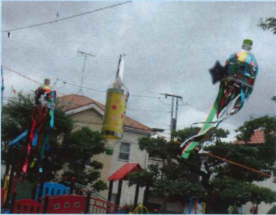
ペットボトルの提灯 素敵でしょ