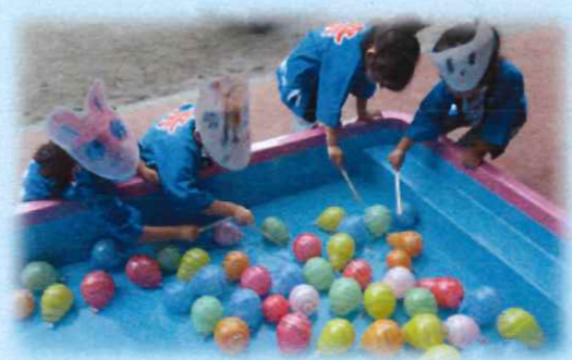
ぜったいあお いろのをとるよ