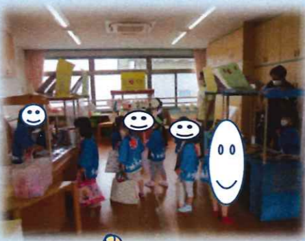
たこ焼き、 おいそー フラペチーノは ミックスあじ