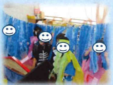
一週間を七夕週間とし、子どもたち自ら、どんな お店をだすのかどういうお店にするのかなど 大人顔負けのアイデア満載でたなばた祭りの たこ焼きの返しや、綿あめづくりも職人のような 手さばきでした。一人ひとりが満足顔でとてもい い顔をしていました。