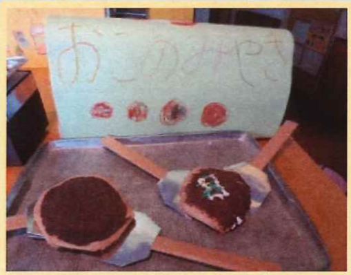
子ども達の手作り おこのみやき わたあめ たこ焼き フラペチーノ お面やさん