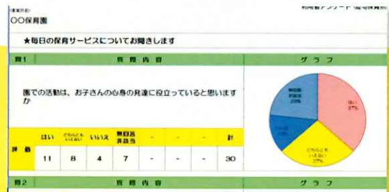
集計シートのサンプル

■ 東京都福祉サービス第三者評価評価機関（株式会社福祉規格総合研究所）がアンケートの集計処理を行い、園にフィードバックします。